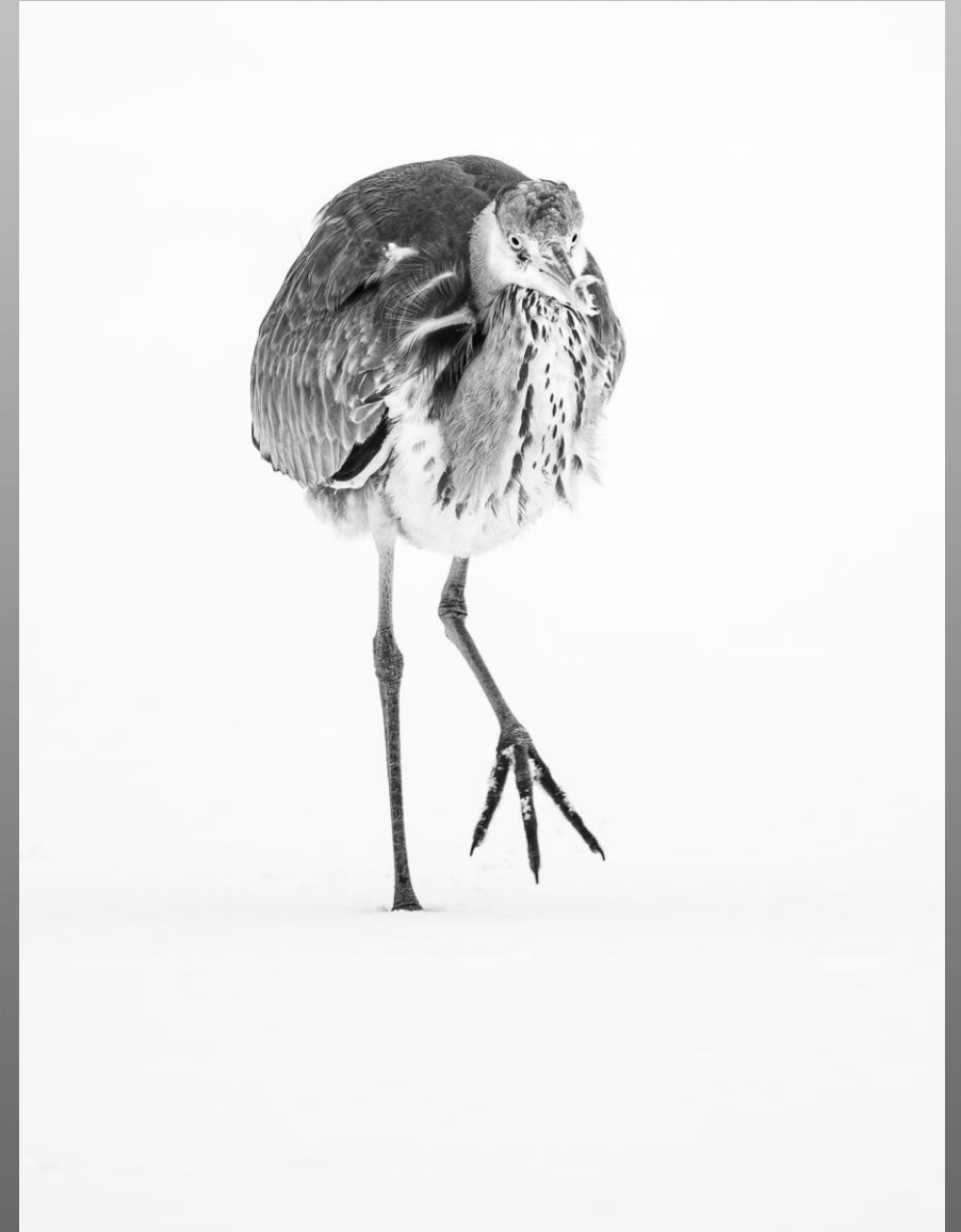
Bildtitel: Häger i snöyran