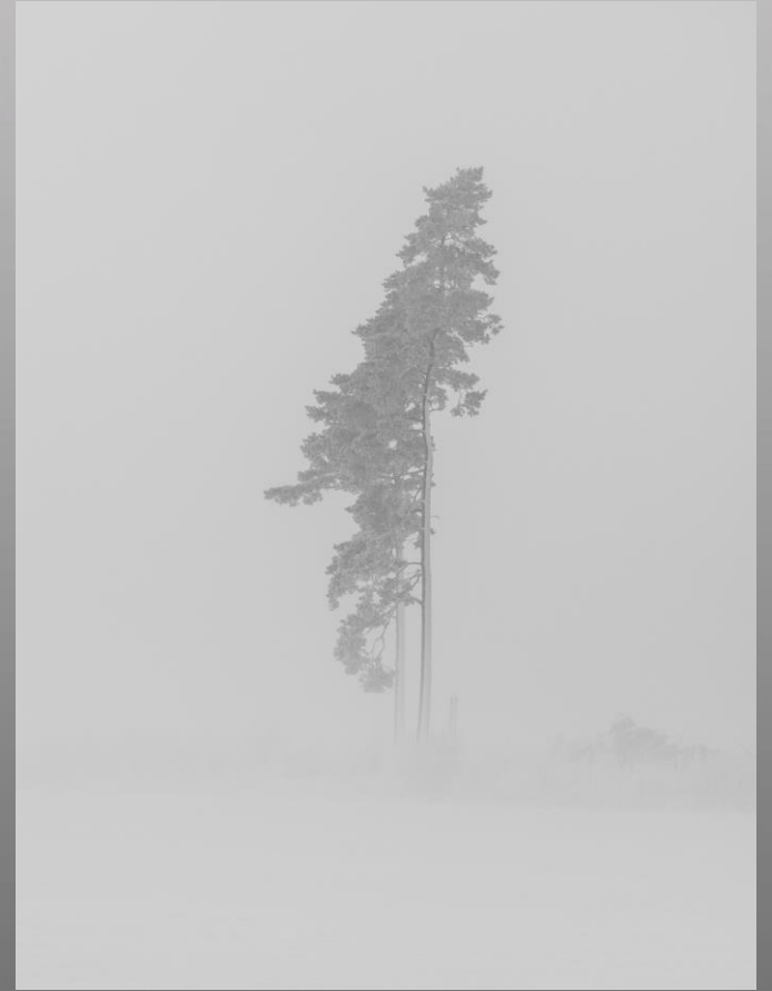
Bildtitel: Ödslig