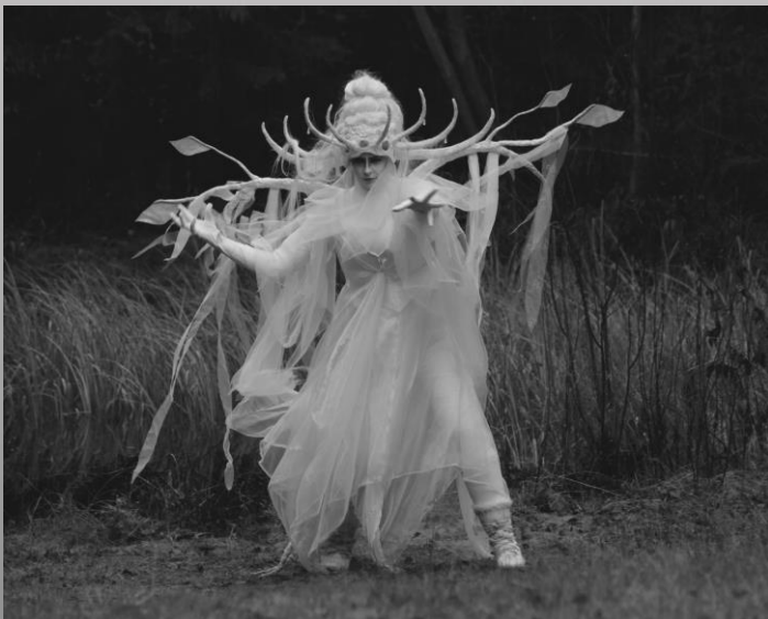
Bildtitel: Dimäladansen